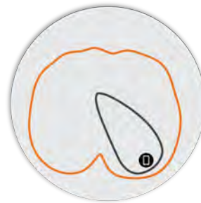
Рисунок 5. Вертикальная плоскость 5 ГГц R350