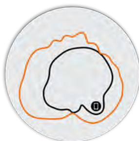
Рисунок 4. Вертикальная плоскость 2,4 ГГц R350